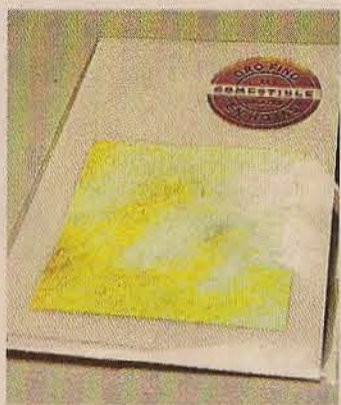
▶ En láminas.