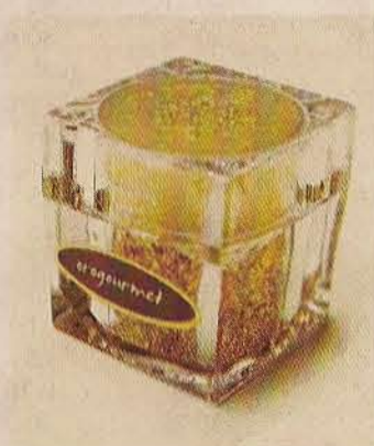
▶ Los saleros.