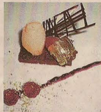
▶ Postre de Ignacio Echapresto.