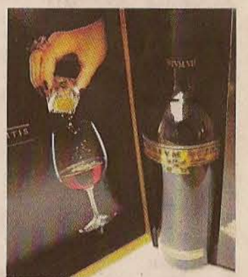
▶ Para añadir al vino.

Una empresa riojana acerca el oro y la plata, como aditivos comestibles insípidos e ino- cuos, para aderezar con lujo los platos más 'chics' en las cocinas profesionales y domésticas