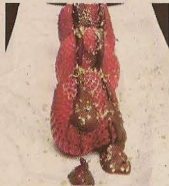
▶ Fresas con chocolate.