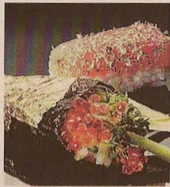
▶ Sushi con oro.