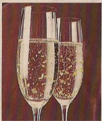
▶ Añadido al cava.