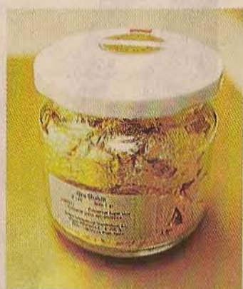
▶ En virutas.