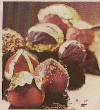
▶ Avellanas doradas.