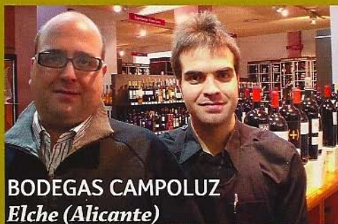
BODEGAS CAMPOLUZ Elche (Alicante)